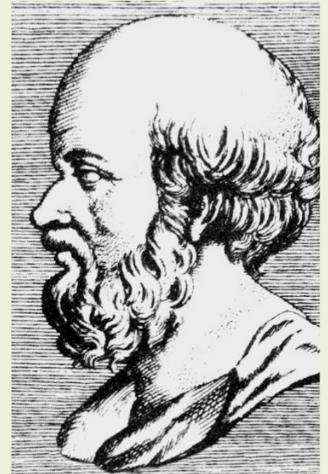
Slika 1. Eratosten